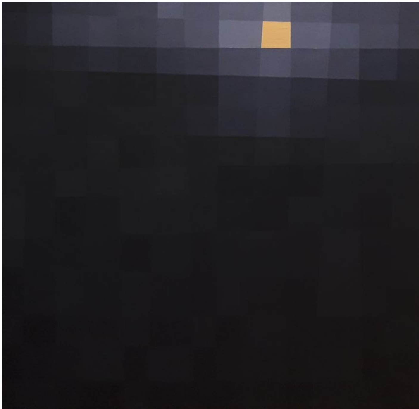
Ускоро / 2019, уље на платну, 100 x 100 cm Soon / 2019, oil on canvas, 100 x 100 cm