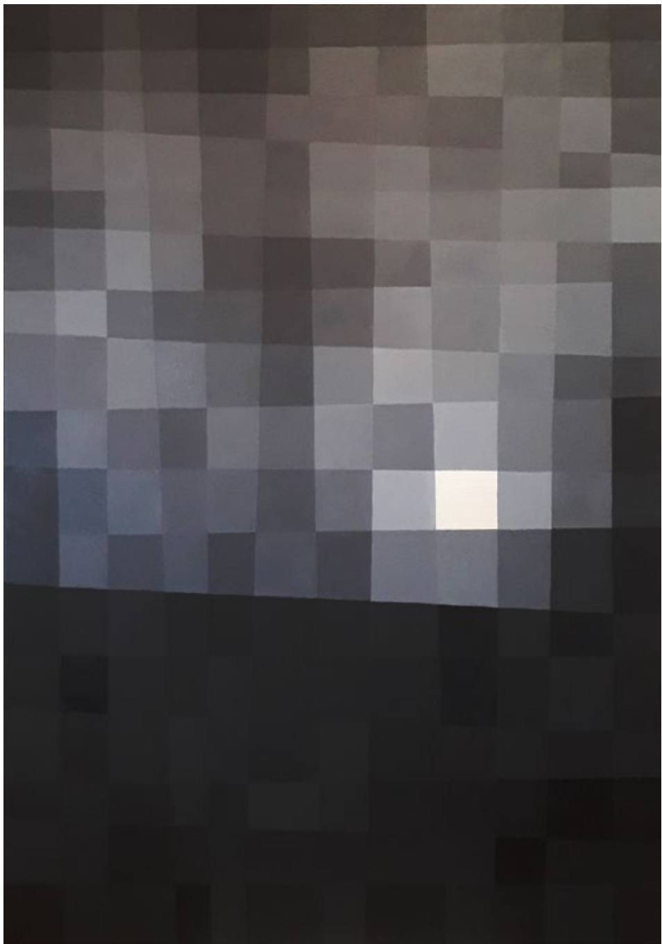
Лаку ноћ, Месече / 2019, уље на платну, 100 x 70 cm Goodnight Moon / 2019, oil on canvas, 100 x 70 cm