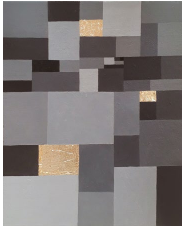
Светионици / 2019, уље на платну, позлата, 50 x 40 cm Beacons / 2019, oil on canvas, gilded, 50 x 40 cm