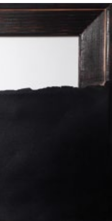
лъеном платну, 30 x 30 cm сваки urned canvas, 30 x 30 cm each