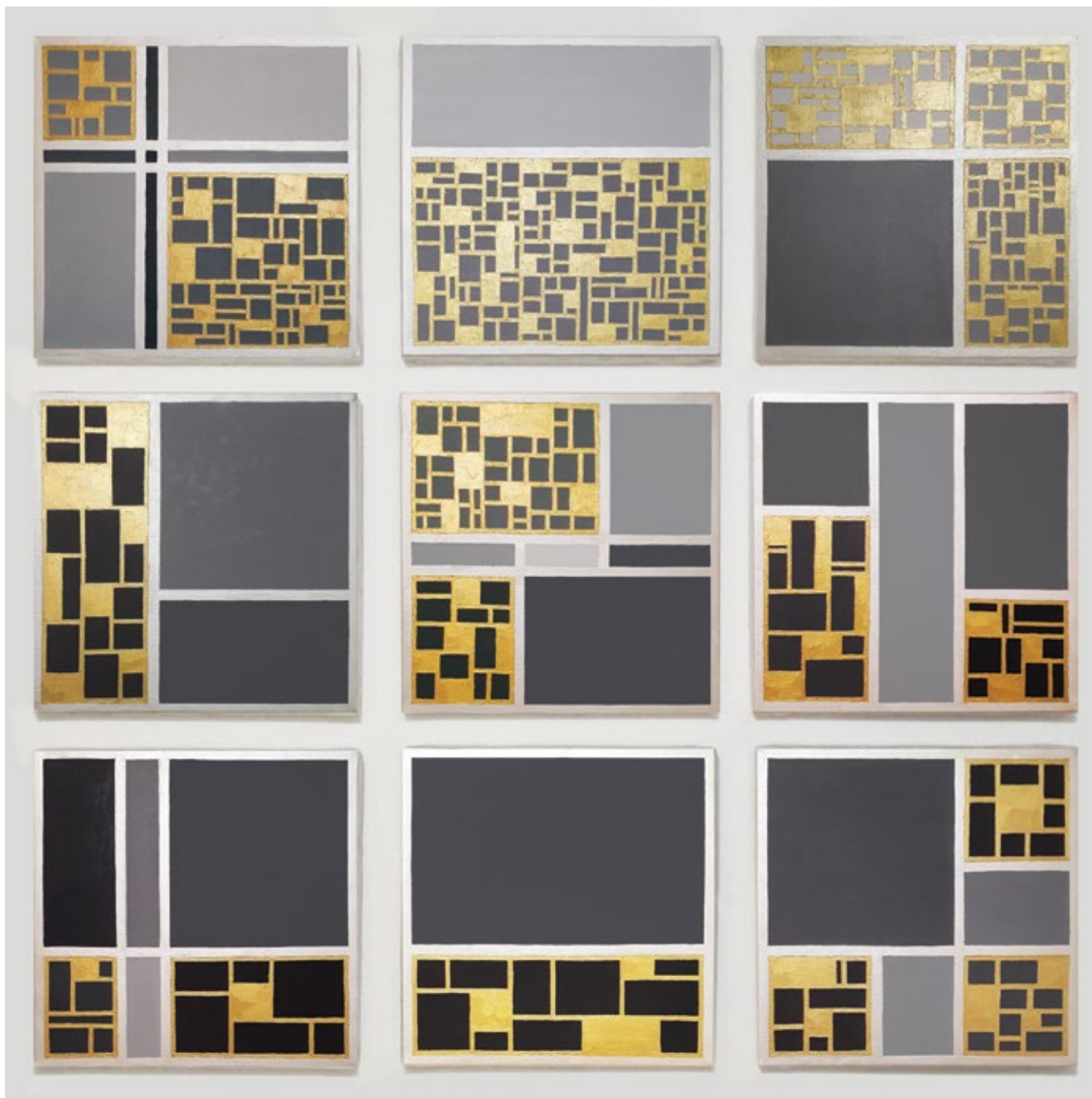
Златне нијансе сиве / 2018, уље на платну, полиптих, 100 x 100 cm Golden Shades of Gray / 2018, oil on canvas, polyptych, 100 x 100 cm