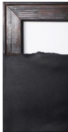
Златни рез / 2019, акрил на спа Golden Cut / 2019, acrylic on b