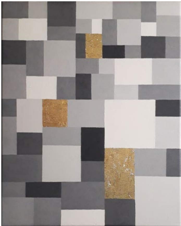
Магла / 2019, уље на платну, позлата, 50 x 40 cm Fog / 2019, oil on canvas, gilded, 50 x 40 cm