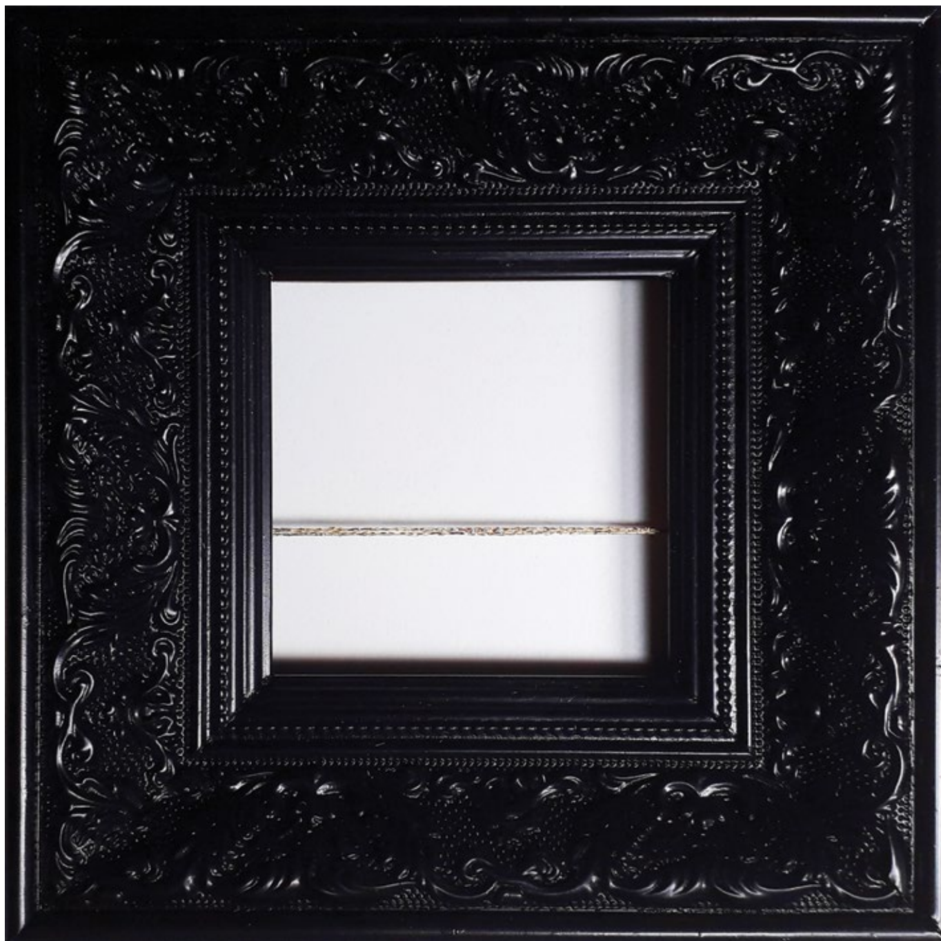
Златна нит (деталј бр. 8) / 2020, рам, конач и простор, 19 x 19 cm The Golden Line (detail No. 8) / 2020, frame, thread and space, 19 x 19 cm